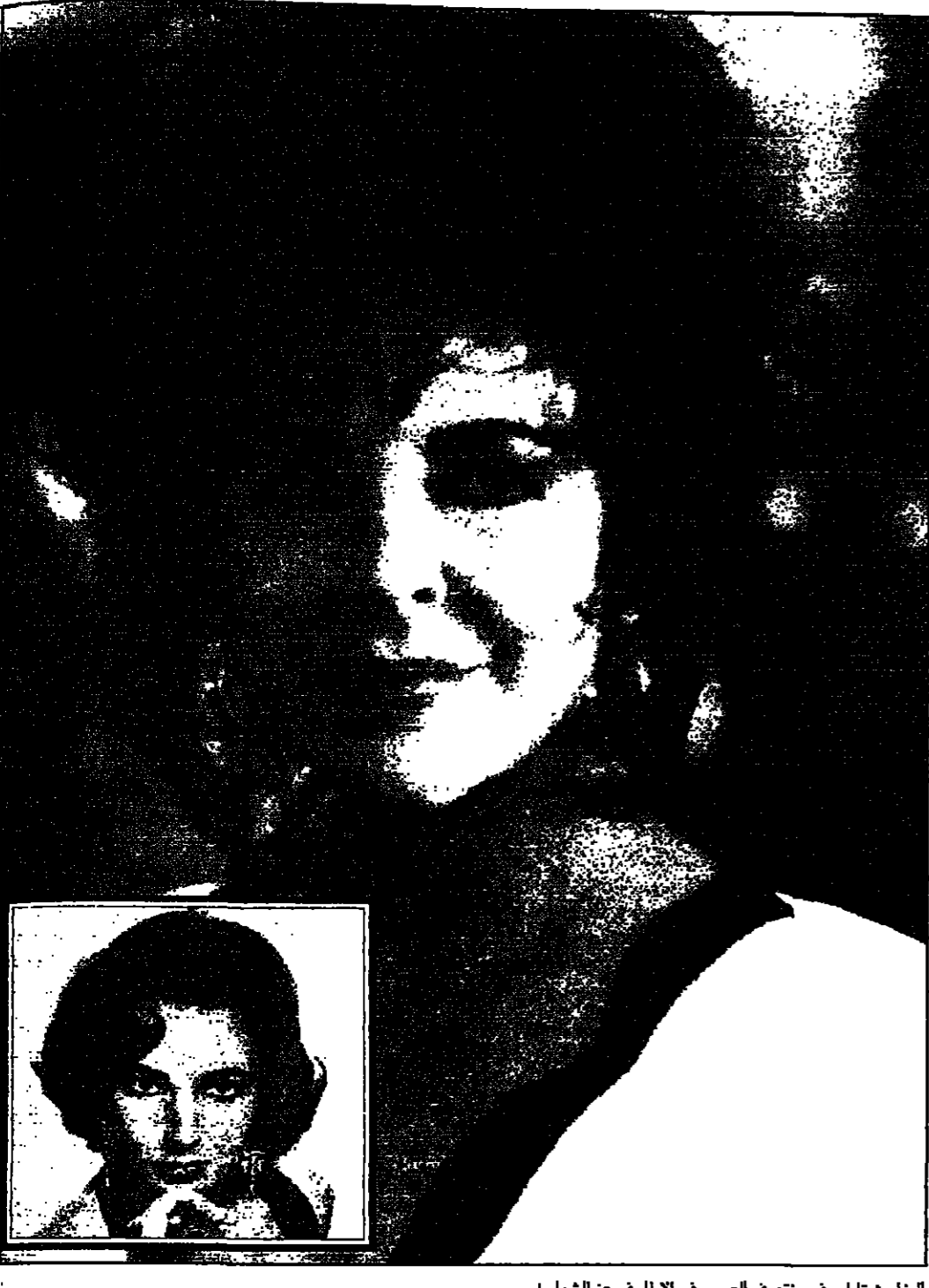
اليزابيث تايلور في منتصف العمر، وفي الأظفار في عز الشباب